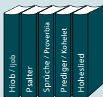
Lehrbücher / Psalmen