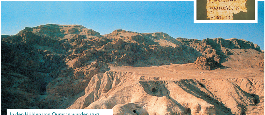
In den Höhlen von Qumran wurden 1947 zahlreiche Schriften aus der Bibel gefunden.