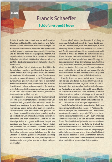
Francis Schaeffer (1912-1984) war ein einflussreicher Theologe und Pastor, Philosoph, Apologat und Kulturkennner. In weit beachteten Hochschulvorträgen und Podiumsdiskussionen mit führenden Akademikern seiner Zeit wusste er modernen Menschen das Evangelium und die biblische Weltanschauung zugänglich zu machen. Mittelpunkt seines Lebens war die Kommunität Cedar (Die Zufallschleife), die sich ab 1955 in den Schweizer Alpen in der Nähe des Genfer Sees rund um die Familie Schaeffer entwickelte. Als Schaeffer 1948 als Missionar aus den USA in die Schweiz kam, musste er bald feststellen, dass die üblichen Ansätze für Evangelisation und Gemeindebau in moderner Mitteleuropa nicht mehr funktionierten. In der Krise zog er sich inszeniert in die Bibelbesuchung zurück. Dabei ging ihm auf, wozu vieles in christlichen Kreisen krankhaft: Geistliches Leben wurde dem irdischen (weltlichen) Leben entgegengesetzt. So gerieten weite Teile menschlichen Lebens wie Freundschaft, Esskultur, Kunst und Literatur unter Verdacht, geistlich belanglos oder gar gefährlich zu sein. Demgegenüber erkannte Schaeffer in aller Klarheit, was eine gesunde Schöpfungstheologie bedeutet: Gott hat diese Welt gut geschaffen, nach dem Neuen Testament geht es darum, Christus über das ganze Leben Herr sein zu lassen. Dabei sollen auch alle irdischen Lebensbereiche unter seine Herrschaft gebracht und von ihr aus neu und lebensbejahend gestaltet werden. So entstand die Gemeinschaft Cedar ganz natürlich aus der Familie und ihren Beziehungen - und mit ihr eine lebendige Kultur von gutem Malzbraten, Gesprächen, Vorträgen und Festen, gemeinsamen Kirchen, Arbeiten, Studieren und Diskutieren. Schaeffers Beschäftigung mit Kunst und Kultur, in die er seine wachsende gläubige Anhängerschaft einbezog, wurde von vielen Christen für manche gab dieser Einfluss den Ausschlag, eine berufliche Laufbahn als Maler, Schauspieler oder Musikjournalist anzugehen, was sie bis dahin nicht gewagt hatten.

Viele Orte aus biblischer Zeit sind dem heutigen Leser unbekannt. Doch wenn wir uns die Geografie der Bibel anschauen, entdecken wir, dass die damalige Welt gar nicht so viel anders war als unsere heutige Welt. Die Ortsbeschreibungen stellen den betreffenden Ort auf der Landkarte dar und bieten Informationen über ihn und über das Leben der Menschen, die dort wohnten.