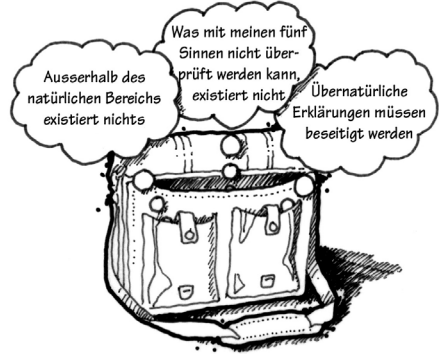
Gefährliche Grundannahmen für Personen, die nach der Wahrheit suchen

Als Skeptiker weigerte ich mich, selbst die geringste Möglichkeit von Wundern zu akzeptieren. Meine Bindung an den Naturalismus hielt mich davon ab, solchen Unsinn auch nur in Erwägung zu ziehen. Aber nach meiner Erfahrung mit falschen Annahmen am Tatort beschloss ich, dass ich fair mit meinen naturalistischen Neigungen umgehen wollte. Ich konnte nicht mit meiner Schlussfolgerung beginnen, und wenn die Beweise auf die reale Existenz Gottes hindeuteten, eröffnete sich dadurch auch die Möglichkeit für Wunder. Wenn Gott wirklich existierte, dann war er der Schöpfer von allem, was wir im Universum sehen. Und somit hat er Materie von Nichtmaterie getrennt, Leben von Nichtleben; er schuf Raum und Zeit. Gottes Erschaffung des Universums wäre gewiss nicht weniger als ... ein Wunder. Wenn es einen Gott gab, der den Ursprung des Universums erklären konnte, wären kleinere Wunder (wie z. B. das Gehen auf dem Wasser oder die Heilung von Blinden) gar nicht so beeindruckend. Wenn ich die Wahrheit über die Existenz eines wunderwirkenden Gottes erfahren wollte, musste ich zumindest meine Annahmen über Wunder ablegen. Meine Erfahrung an Tatorten hat mir dabei geholfen. Das heisst nicht, dass ich jetzt jedes Mal nach übernatür-